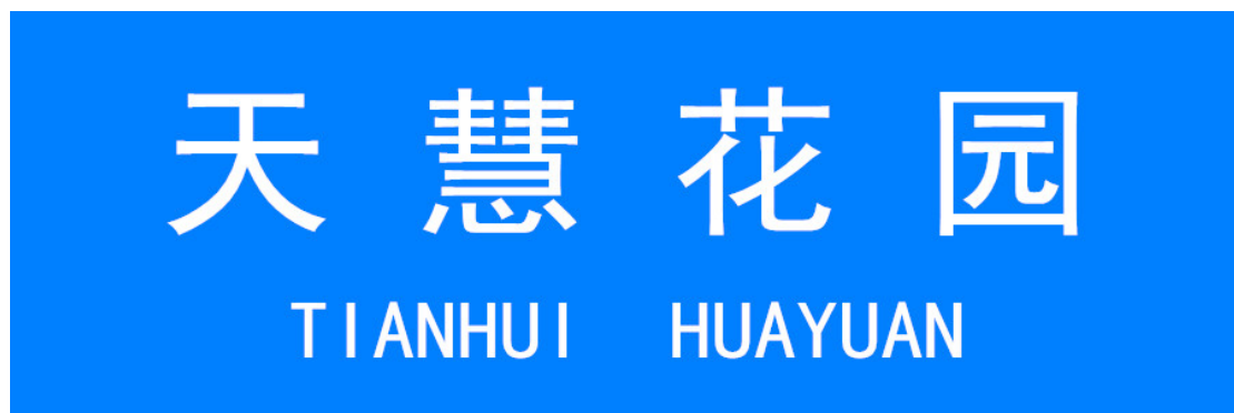
图1 住宅小区地名标识标志设置样式